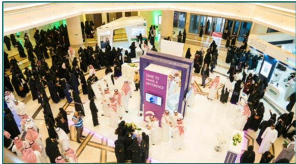
The Career Future: Ambition and Options in the current Variables

The program also included the opportunity for graduates to attend individual mentoring session provided by a group of professional mentors from various colleges of Princess Nourah University in addition to number of trainers who have been trained at the GCDF (Global Career Development Facilitator), which is internationally certified by the National Board for Certified Counselors in the USA. Princess Nourah University is considered the first university in Saudi Arabia that is applying professional guidance and mentoring according to the international standards in order to provide support and counseling for students and graduates in the professional field.