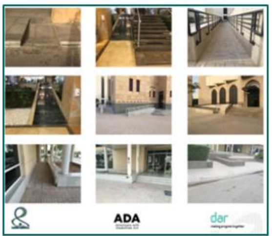
ADA STANDARDS COMPLIANCE IN PNU CAMPUS