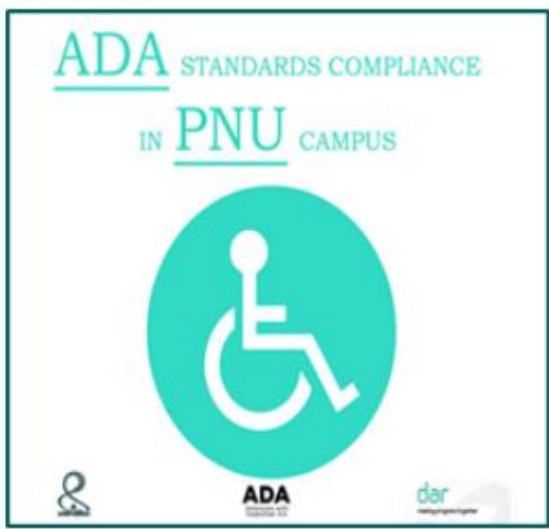
ADA STANDARDS COMPLIANCE IN PNU CAMPUS

A detailed display facility for available services