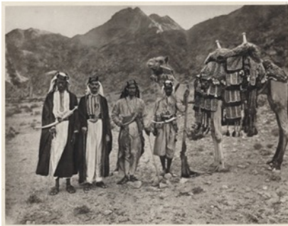
شكل (2) (Hurgronje, 1889)