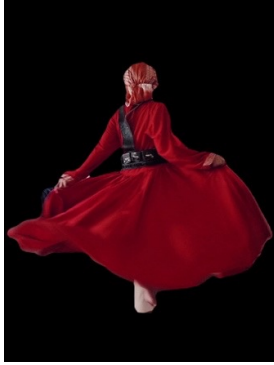
شكل (10) المظهر النهائي للزي المستخدم في رقصة الخبتي

(9). كما اتفق وصف السروال المذكور مع دراسة فدا (2007) "التراث التقليدي لملايس الرجال في المنطقة الغربية من المملكة العربية السعودية" فيما يخص ارتداء السروال المشفول في تقنية التخريم والآجور، ونوع الخامة في استخدامهم قماش البفتة باللون الأبيض، ويتفق ذلك مع ما ذكرته (فدا، 2007) في تصنيفها لأنواع الأقمشة والخامات المستخدمة في ملابس الرجال .