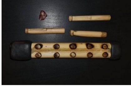
شكل (4) قطعة أثرية من البوص

من أقدم الآلات الموسيقية، صُنعت أولاً من قرون الحيوانات، ثم من قصب السكر، ثم الألمنيوم، وتُستخدم الآلة عبر النفخ بها، وسد الفتحات، للتحكم في الصوت، حيث تشبه الناي، وتختلف باختلافها على قصبين متصلين ببعضها البعض، كل قصبة تحوي خمس فتحات، فيصل إجمالي الفتحات إلى عشر، ويرافقها اثنان من البلايل المجوفة التي يبلغ طولها 5 - 8 سم، التي تلف حولها خيوط رفيعة للتحكم في وزنية النفخ، الموسيقي. شكل (4)