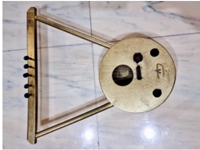
شكل (5) السمسمية: يقدر عمرها ١٢ سنة

إحدى الآلات الموسيقية القديمة. صُنعت السمسمية من جوالي السيارات، بعدد 5 أوتار مصنوعة من أسلاك الهاتف القديمة، حيث كان يتم نزع طبقة البلاستيك، ويتم استخراج أخف سلك، ليتم استخدامه كوتر للآلة، ثم صنعها من فرامل الدراجات، فيتم استخدام السلك المتواجد في الجلادات. شكل (5)