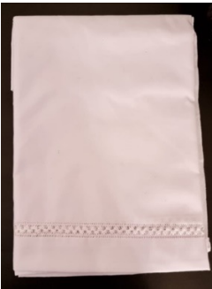
شكل (8) السروال المشفول

حزام من الجلد يثبت حول الوسط، تم ارتداؤه في مناطق المملكة العربية السعودية على حد سواء، خاصة في فترة الحرب، حيث كان يتم تعبئته بالملح البارودي، في فن الخبتي لبس كوظيفة عملية في تثبيت الثوب أثناء الحركة أولاً، وثانياً كوظيفة جمالية للثوب.