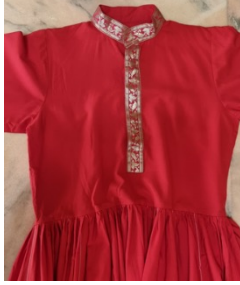
شكل (6) ثوب الحويسي

سُمي بالحويسي من التحويس أثناء اللعب، وهو ثوب بأكمام طويلة يصل طوله للركبة أو فوقها، ويتسع من خط الوسط بثنيات متراكبة بجانب بعضها البعض، يصنع من خامة السليطي والبفتة. اعتاد أن يستخدم اللون الأبيض، ثم تتم صباغته باللون الأزرق، والأخضر، والأحمر، والبنفسجي، وأحياناً الأصفر، ويتميز بالاتساع أثناء الدوران، ويُطرز على الثوب شكل السيفين، أو سيفين ونخلة، وقد تم استبدال التطريز بالكلف الذهبية والفضية في منطقتي المعصم والرقبة لبعض الثياب المصنعة حديثاً. شكل (6)، شكل (7).