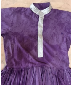
شكل (7) ثوب الحويسي

الثوب الأبيض اليومي، وكان يتميز بالأكمام الطويلة جداً، وهو ما يطلق عليه بـ "المردون" في منطقة نجد. كما اتفق مع دراسة البسام (2005)، "الملابس التقليدية الرجالية في المنطقة الشرقية من المملكة العربية السعودية" في أن ثوب المحاريد "المردون" استخدم في الرقصات الشعبية، وتتميز بالأكمام الطويلة.