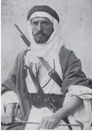
شكل (1) (Casey, 2019)

يا حاضرين الصيف قولوا لأبويه : ثوبي تقطع والمحاريذ ذابت وقد ذكر في البيت السابق ثوب المحاريذ، وهو الثوب الحجازي القديم، وتميز بطول أكمامه، ويطلق عليه "المردون" في منطقة نجد، ويعود ارتداء المحاريذ لما يقارب ١٥٠ سنة، وربما أكثر، كما يتضح في الشكل (1)، يظهر المستشرق النمساوي ألويس موسيل، بثوب المحاريذ في عام ١٩٠١م.